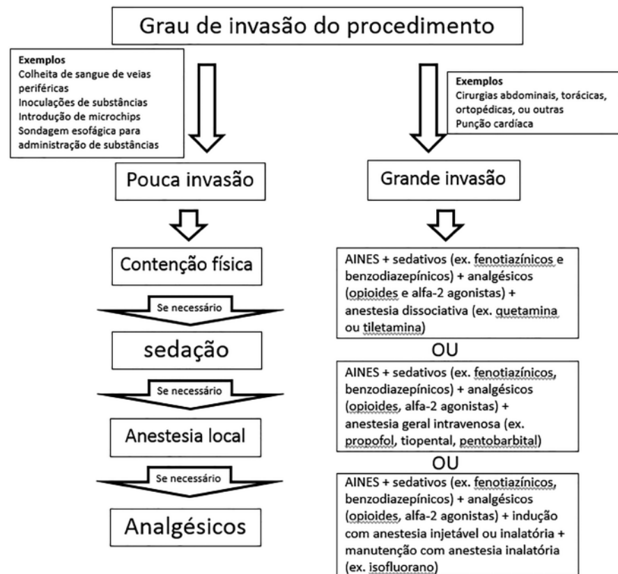
Figura 1 - Exemplo de opções de controle da dor classificadas de acordo com o potencial do procedimento em resultar dor ou estresse ("grau de invasividade"). AINES: Anti-inflamatórios não esteroides